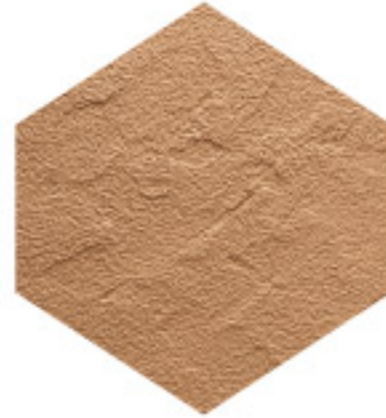
تراديشنال تيكس TRADITIONAL TEX