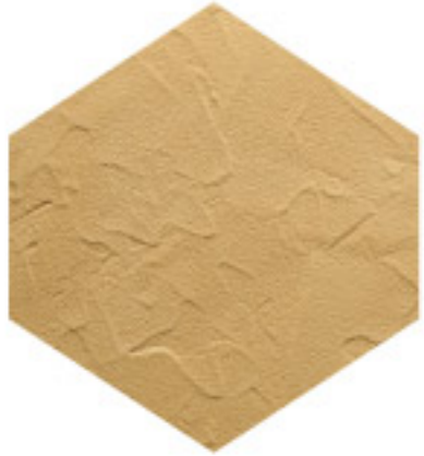
أنتيك تيكس ANTIQUÉ TEX