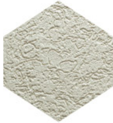
كلاسيك تيكس CLASSIC TEX