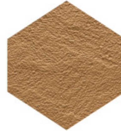
هاي بيلد HIGH BUILD